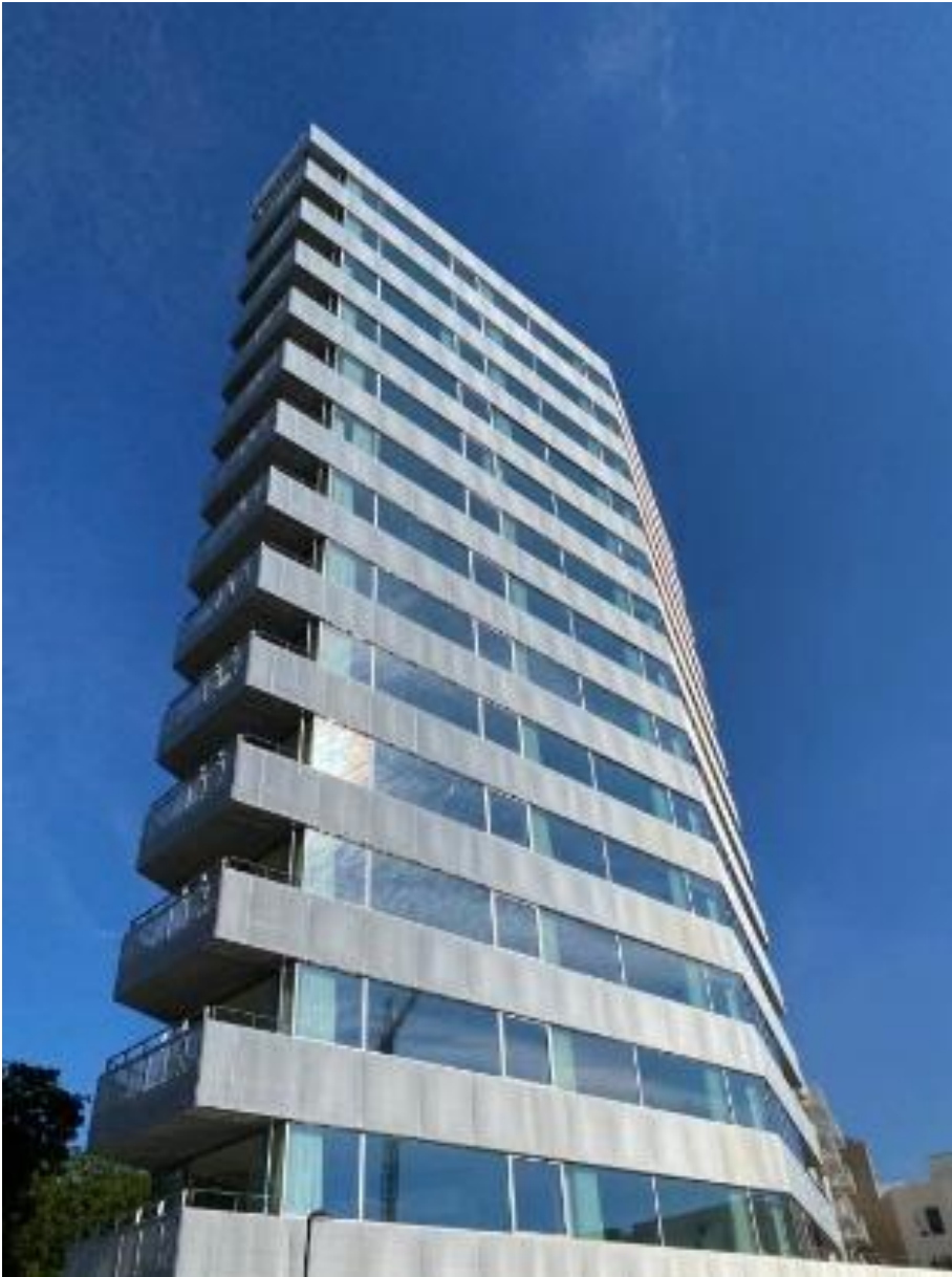
SPINX Bryggen STAY, København NY BYG Stay hotellejligheder 2018 service lejligheder